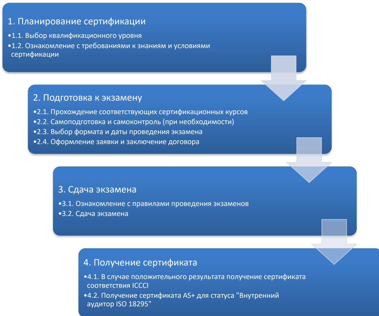
Рисунок 2. Процесс сертификации